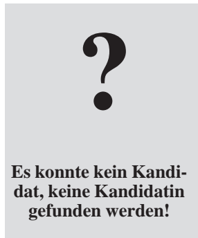
Hier könnte Ihr Name stehen!